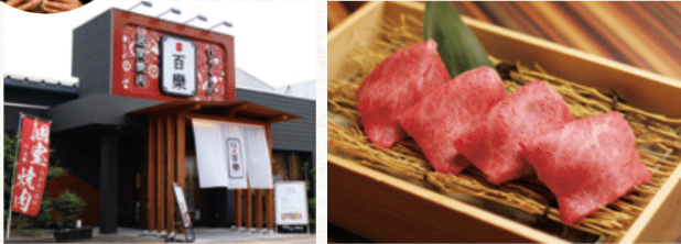
全室個室で、ゆっくりくつろげます。

11:00~14:30L.O. / 17:00~22:00L.O. 第一月曜定休、ほか不定休あり 奈良市中登美ヶ丘6-7-31 TEL 0742-51-1515