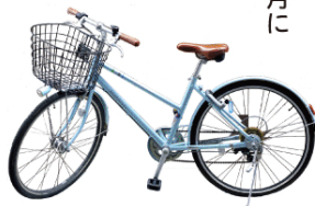
お洒落なスカイブルーの自転車を70台配備する。タイプは2種類。

中でも就労支援事業の中心となるのが「ハブチャリ」です。そもそも、おっちゃんたち（スタッフ・ボランティアはホームレスの人を、親しみを込めてそう呼ぶ）は自転車で廃品回収をする人が多く、「自転車修理が得意だ」と知ったことから生まれた事業で、2014年4月にスタートしました。