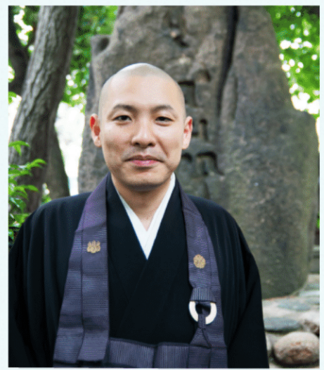
◆子どもと一緒に万博記念競技場へガンバ大阪の応援に行くことも あるそうです。