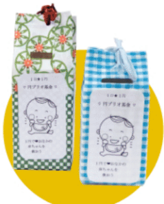
「ひと口1円」の基金箱は、1円玉のみを入れると思われがちですが、10口10円、100口100円などもOKとのこと。

この活動は、全国で展開されています。皆さんの近くでも「小さな生命を考える懇談会」「小さな生命を守る母親の会」などが活動されています。