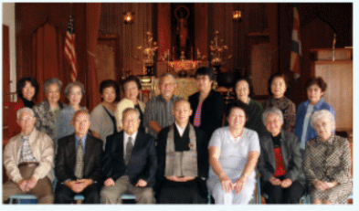
◆住職をつとめた「ロングビーチ仏教会」。

「日曜礼拝のよ うな形がお寺の 活性化のヒント になるはず」と、 海外での経験を ベースに人々と のつながり方を 模索しています。